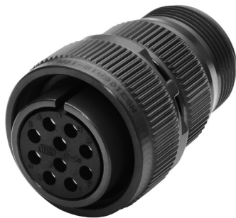
Connecteur femelle avec écrou de raccordement